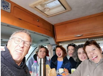
Petit déjeuner frugal...une dernière photo avant les préparatifs.