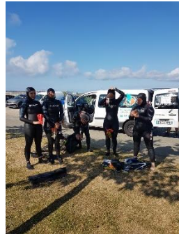
Dernières mises au point, ça y est...